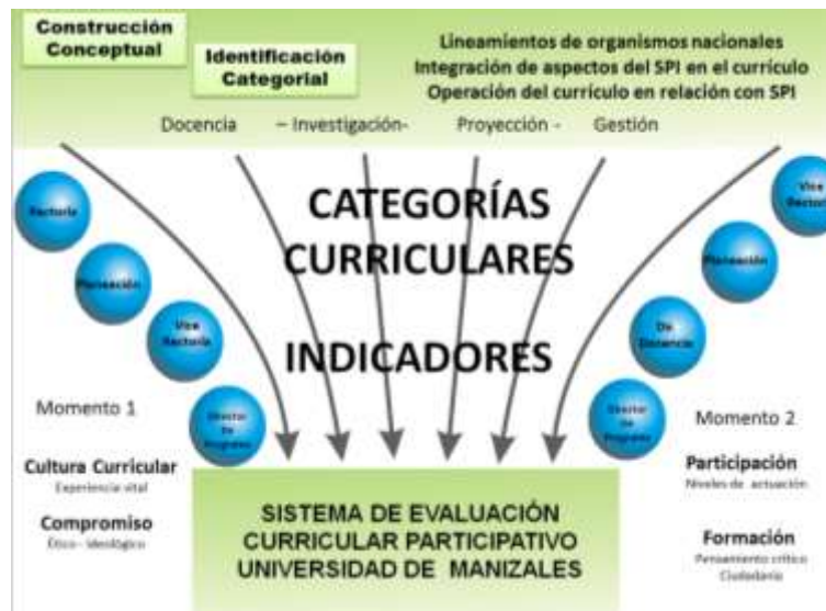
Figura 2: Categorías e indicadores curriculares